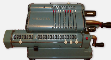
Calculadora Melitta perteneciente a nuestra colección particular; fabricada en Alemania a mediados del siglo pasado y utilizada por los profesionales de la contabilidad.